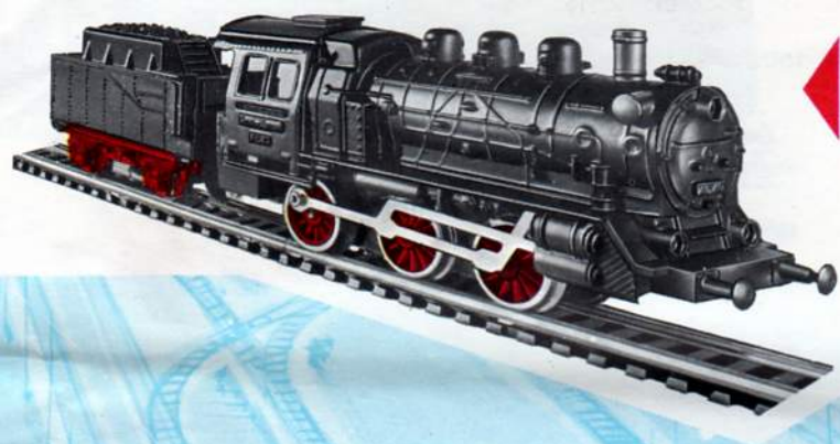
2001 - 3-assige locomotief met 2-assige tender - 20,8 cm. - 9/12 Volt