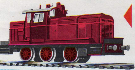
1602 - Diesel-locomotor - 11,5 cm. - 9/12 Volt