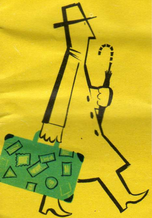
9301 - Internationale bagagewagen 24 cm.