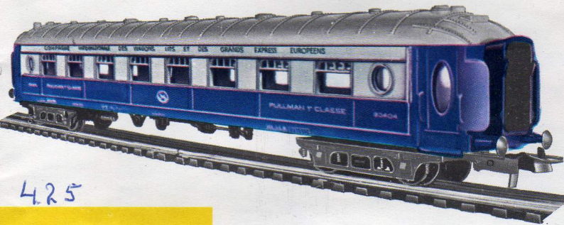
9201 - Pullman-rijtuig - 24 cm.