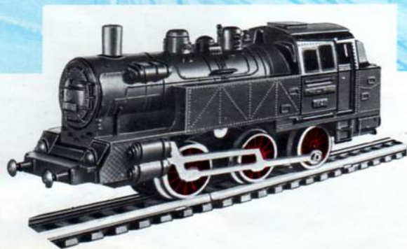
1601 - 3-assige locomotief - 12,9 cm. - 9/12 Volt