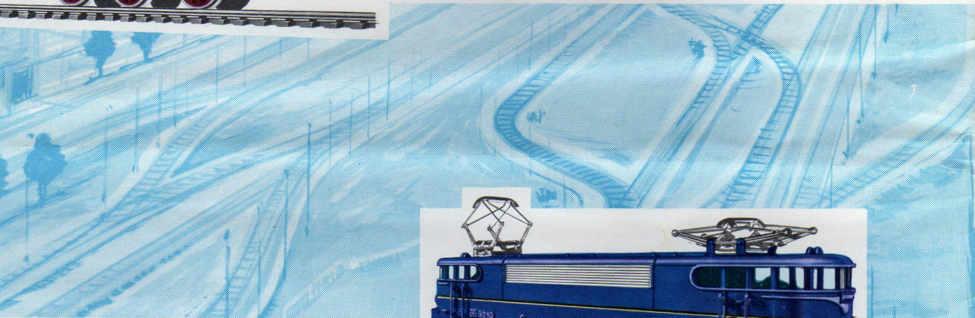
- Franse elektrische locomotief "BB serie 9200", 19,5 cm. - 9/12 Volt. Beide zijden zijn voorzien van twee koplampen welke gelijktijdig met de rijrichting automatisch worden omgeschakeld.